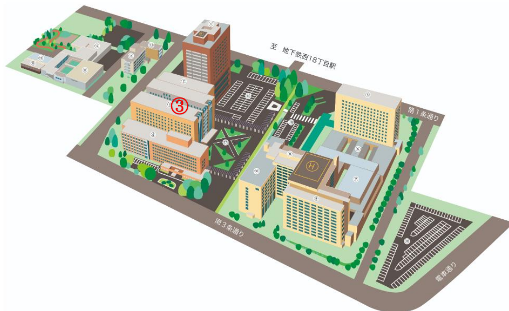
施設配置図(2023年1月時点)