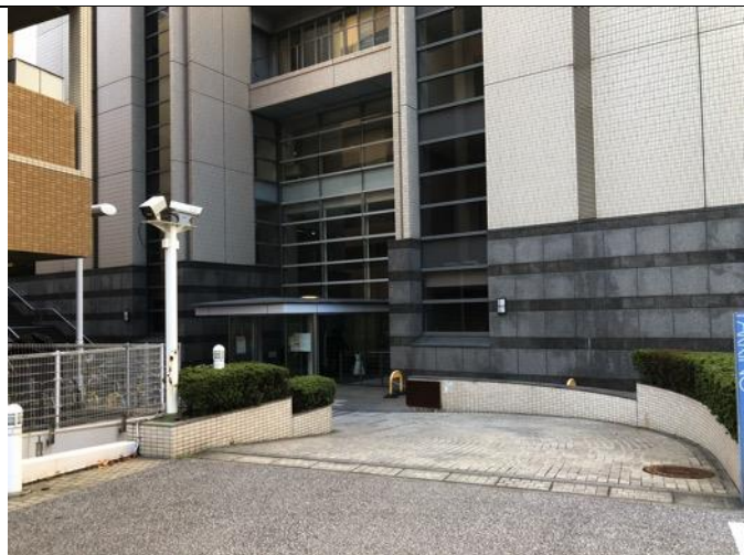
写真3 医学部学舎正面ゲートを通り、自動扉へ