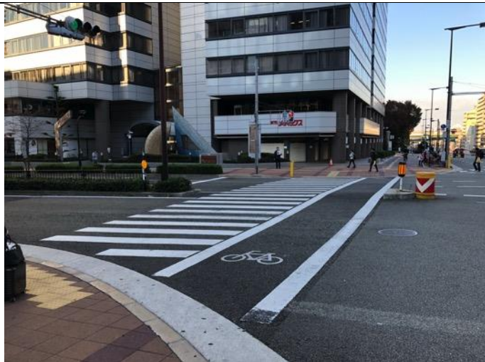
写真1 阿倍野ルシアスを通り過ぎてから 信号を渡って、阿倍野メディックスへ